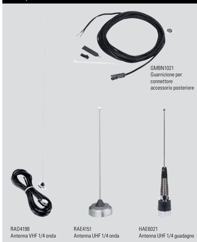
GMBN1021 Guarnizione per connettore accessorio posteriore