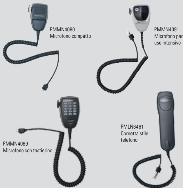
PMMN4090 Microfono compatto